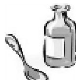
du sirop (contre la toux)